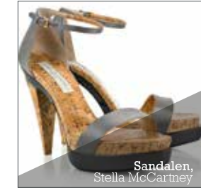
Sandalen, Stella McCartney

Die Anerkennung der einmaligen Eigenschaften von Kork hat den Weg für unendliche Anwendungsmöglichkeiten bereitet.