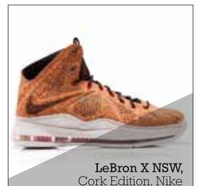
LeBron X NSW, Cork Edition, Nike