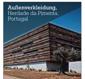
Außenverkleidung, Herdade da Pimenta, Portugal