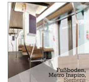
Fußboden, Metro Inspiro, Siemens