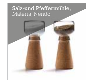
Salz- und Pfeffermühle, Materia, Nendo