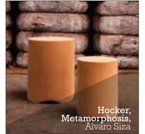
Hocker, Metamorphosis, Alvaro Siza